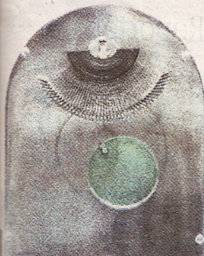
La Vague - 2005.

■ Jusqu'au 7 janvier. MAMAC de Nice, Tous les jours sauf mardi. Tél. 04.97.13.42.01.