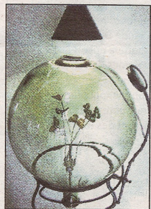
« Dancing in the Greenhouse » - 2003.